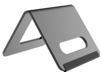
DJS- KAB642-D 支架